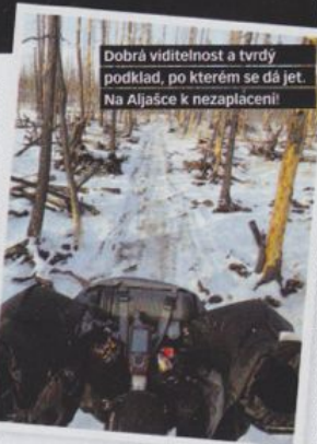
Dobrá viditelnost a tvrdý podklad, po kterém se dá jet. Na Aljašce k nezaplacení!

Měl jsem párkrát takový halucinace z únavy a mrazu, že jsem si nahlas povídal se svojí přítelkyní, teď už manželkou, až jsem se z toho rozbřečel. Pak jsem se probral a zjistil, že pořád tlačím kolo lesem. Nebo jsem viděl odbočku ke srubu, kde šlo přespat, ale žádný stopy dál, tak jsem si to vyfotil, abych věděl, že se mi to nezdálo. Jede se prostě nadoraz a občas ti úplně dojde šťáva.