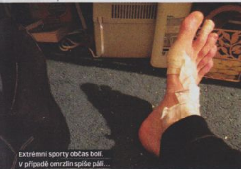
Extrémní sporty občas bojí. V případě omrzlin spíše pálí...

To zase ne. Naštěstí si předem do určených checkpointů můžeš poslat balíky s náhradními baterkami a jídlem, takže průběžně doplňuješ zásoby během závodu. Ale to kolo ti nesmí vážit tunu, že jo?