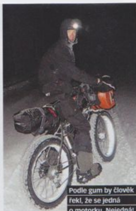
Podle gum by člověk řekl, že se jedná o motorku. Nejedná!

Nemáš. Proto je to ten nejextrémnější závod na světě. Počítá se s tím, že si