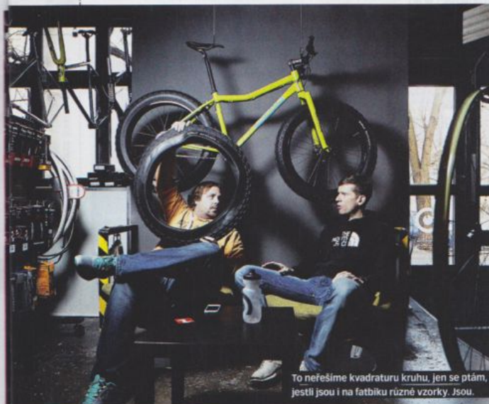
To neféšíme kvadraturu kruhu, jen se ptám, jestli jsou i na fatbiku různé vzorky. Jsou.